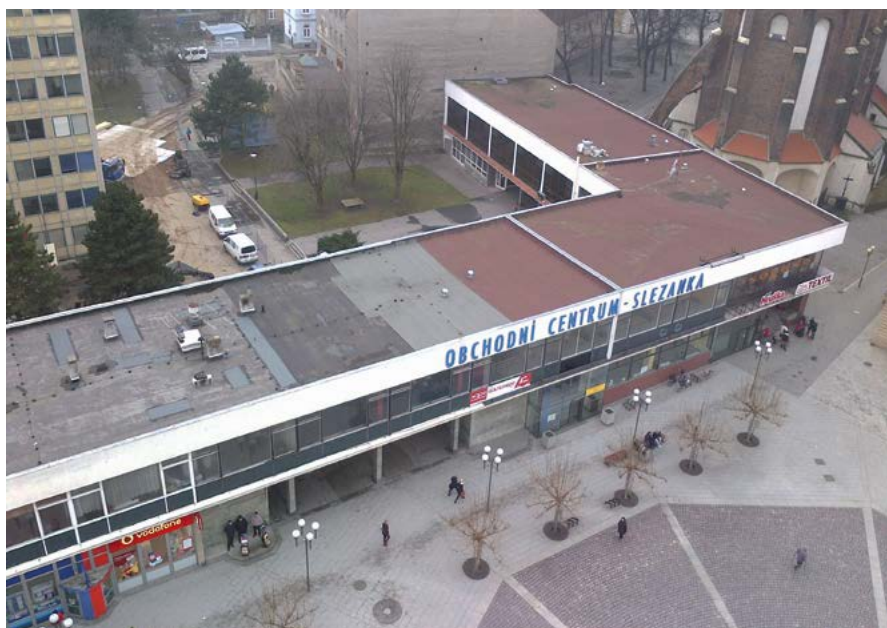
Budova Slezanky těsně před demolicí věžáku ministerstva zemědělství