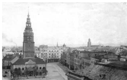
Jiný z předválečných pohledů na Horní náměstí

Realizace obchodního centra by znamenala enormní zvýšení dopravní zátěže v samotném historickém jádru. Nejen stovky osobních aut, ale dlouhá řada kamionů, které by měly zásobovat obchodní centrum, by jezdily přes nejkrásnější část Opavy, kolem středověké konkatedrály. Co udělají otrě-