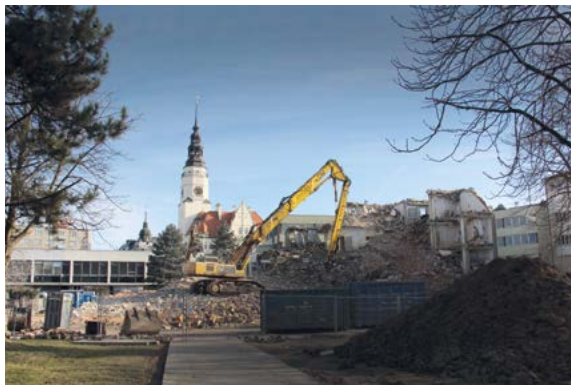
Demolice věžáku ministerstva zemědělství

Cílem developerů je zisk, ale proč by se Opava jako město nemohla zasadit o vytvoření zajímavějšího inspirativního prostoru, který by z opavského centra udělal důstojné prostředí.