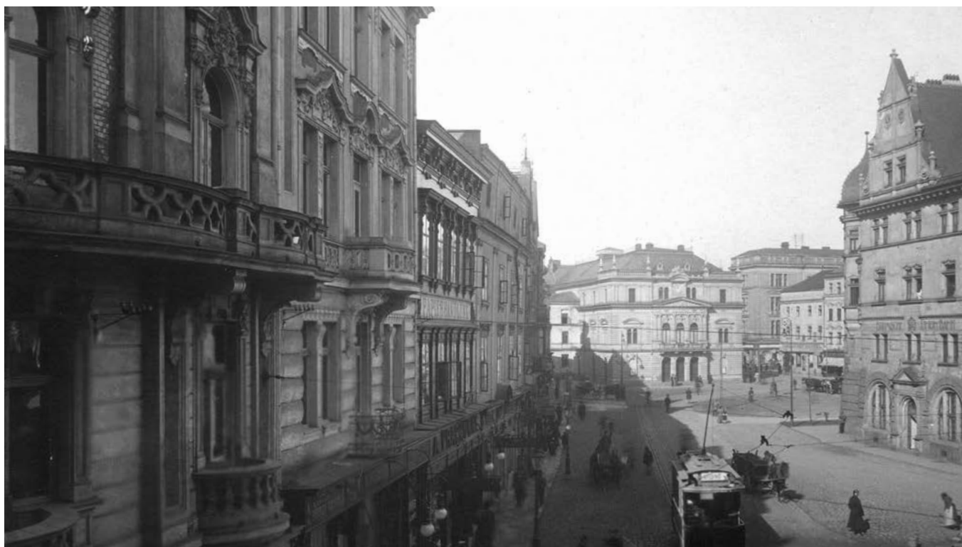
Jižní fronta Horního náměstí po válce ustoupila demolicí.

Opava patří k nejstarším městům u nás. Počátky města se datují od roku 1224, kdy král Přemysl Otakar I. potvrdil opavským měšťanům privilegia.