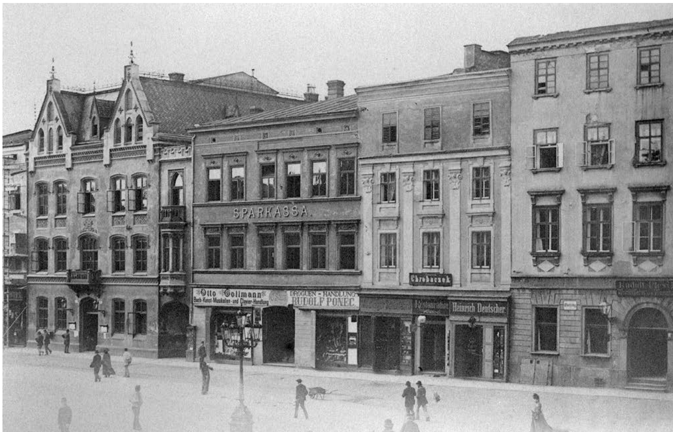
Takto vypadala před 2. světovou válkou fronta domů na místě dnešní Slezanky

Smlouva byla podepsána v roce 2005. Poté byla několikrát upravena a opakovaně podepsána v roce 2007 a v dalších letech. V současnosti je ke smlouvě připojen Dodatek č. 6, který shrnuje a do sebe pojímá