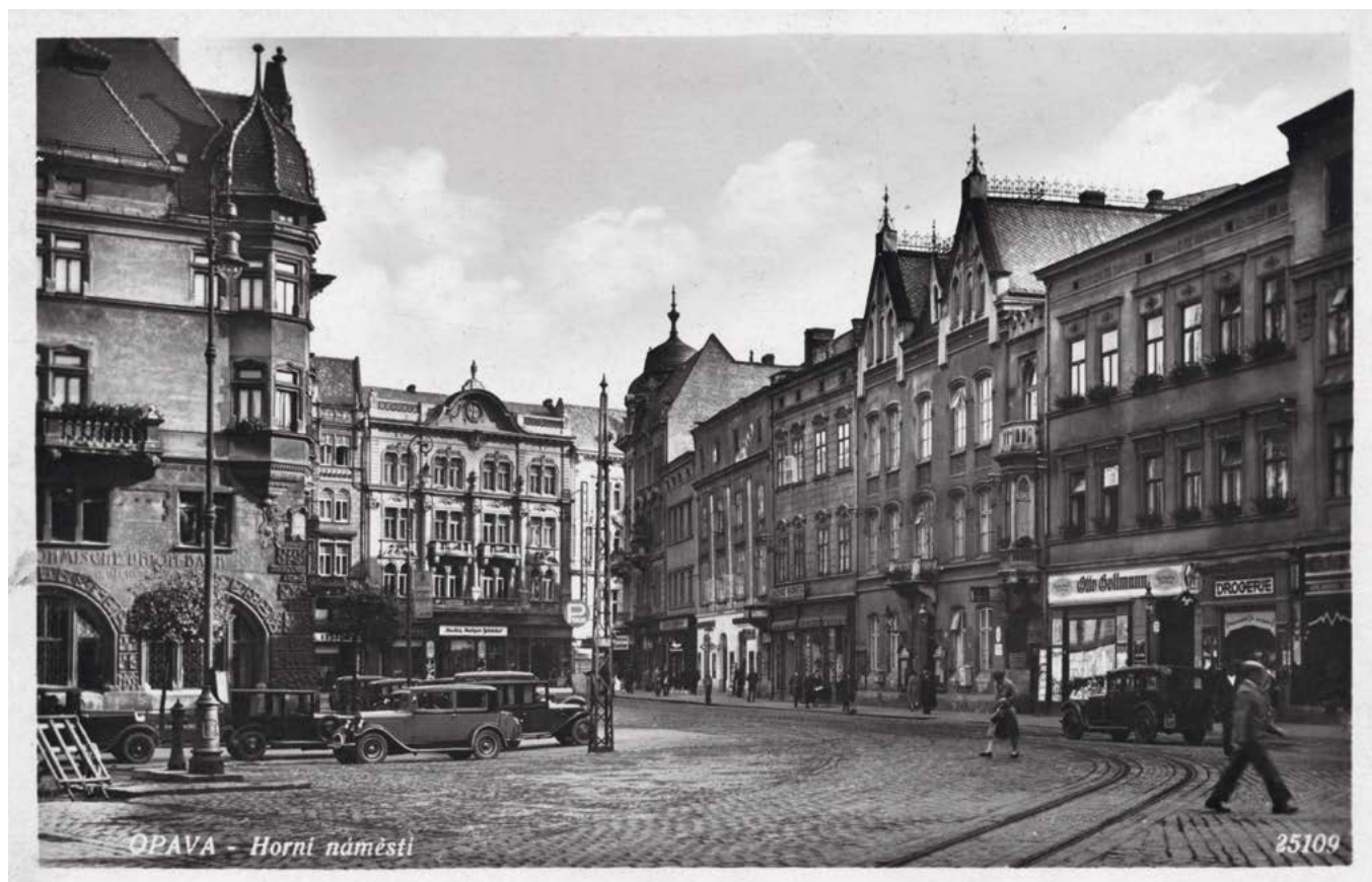
Západní část Horního náměstí v době před 2. světovou válkou

Smlouva je podepsaná, stalo se, vedení města víceméně nezbývá