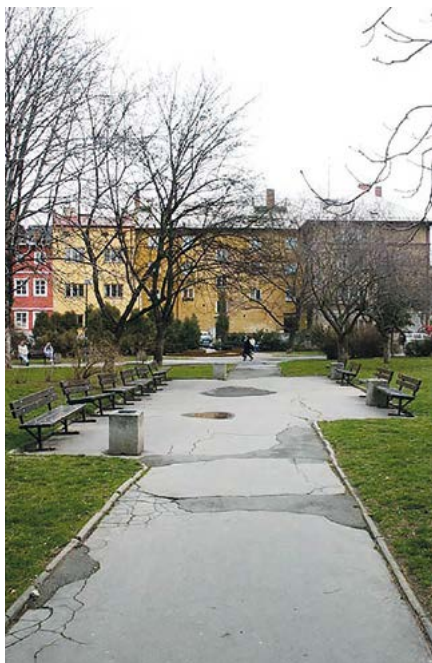
Současná podoba parku za Slezankou

→7 stavebníků a majitelů. Budovy jsou využívány různými způsoby aktuálně reagujícími na potřeby občanů i jednotlivých investorů. Zástavba se vyvíjela postupně v čase – rostla i zanikala. V historických městech bylo přiměřené množství zeleně, která se pěstovala dříve jen v klášterních a palácových zahradách, výjimečně ve dvorech a na veřejných prostranstvích.