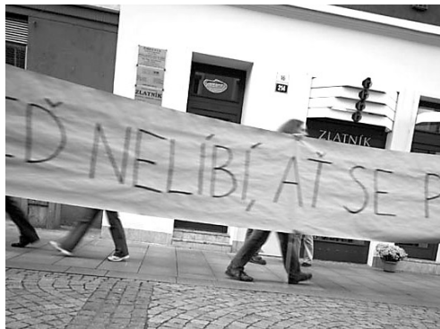
Demonstrace Proti zdi, říjen 2006

Snažíme se na jedné straně vyhledávat a poskytovat hlubší informace o těchto a dalších tématech prostřednictvím našich internetových stránek, poskytování rozhovorů a tiskových zpráv médiím a v neposlední řadě fromou tohoto našeho občanského zpravodaje. Na druhou stranu je naší snahou soustavně působit na zodpovědné orgány, upozorňovat na problematiku místa a slabiny navrhovaných řešení, navrhnout alternativní varianty a kroky k zlepšení situace. Od ledna letošního roku jsme napsali řadu oficiálních podnětů, připomínek, žádostí. Připravili jsme happening u měřírny elektrického proudu, uspořádali několik přednášek, spolupřáteli 1. ročník konference Památky ve Slezsku. Do budoucna se budeme dále zaměřovat na témata, která ovlivňují náš život ve městě, jeho tvář a prostředí. Naším pohledem viděno, nejsme sdružením stojícím v opozici k vedení města, ani jeho obyvatel. Ba naopak, jsme přesvědčeni o tom, že naše aktivity jsou a nadále budou přínosem, jak městu i jeho vedení, tak především všem těm, kterým život v Opavě, úroveň městského prostředí ani kultury nejsou lhostejny. Jsme otevřenou společností vítající jakékoliv podněty a podporu, dokonce i negativní vyjádření může být dobrým impulzem k činnosti.