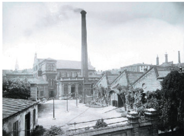
Pohled z ulice Nákladní, Braunův archiv, B 2215 SZMO, okolo roku 1910.