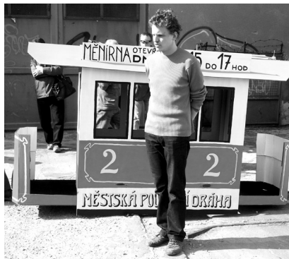
Happening u měřírny, 27. března 2007