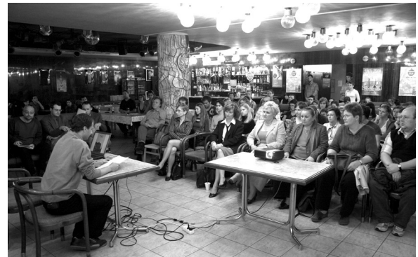
Konference Památky ve Slezsku, 17. května 2007