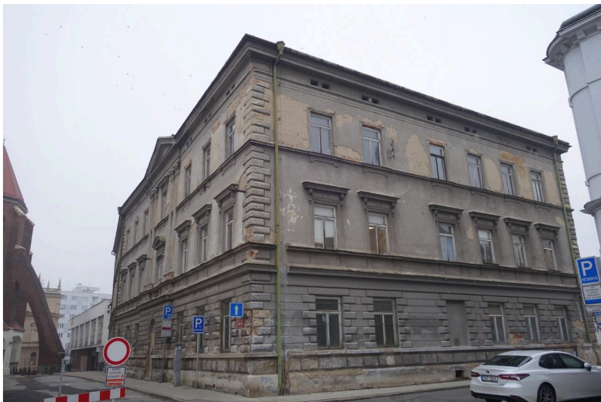
pohled od JZ: vpravo prohlašovaný dům na Rybím trhu č. 4 v Opavě, vlevo konkatedrála Nanebevzetí Panny Marie s opěrným pilířem, vzadu vpravo OC Slezanka a vlevo Slezské divadlo Opava