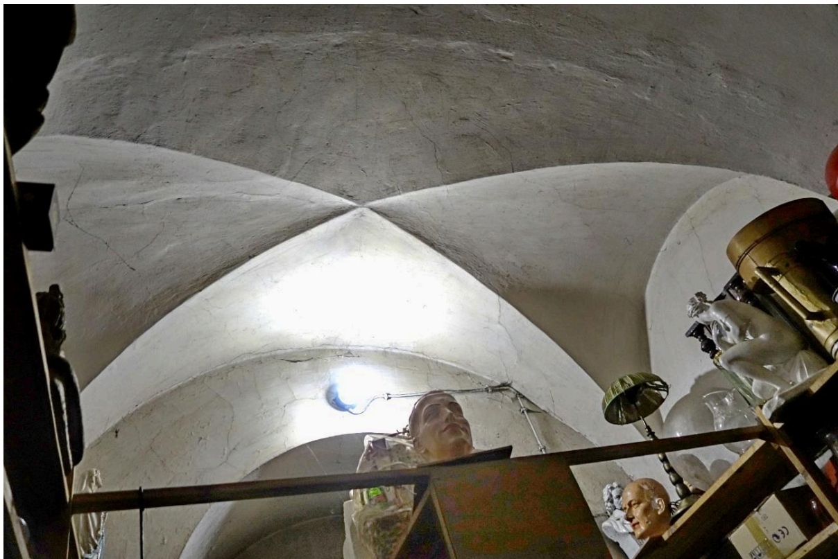
klenba v prostorách rekvizitárny divadla a dílen v 1. NP