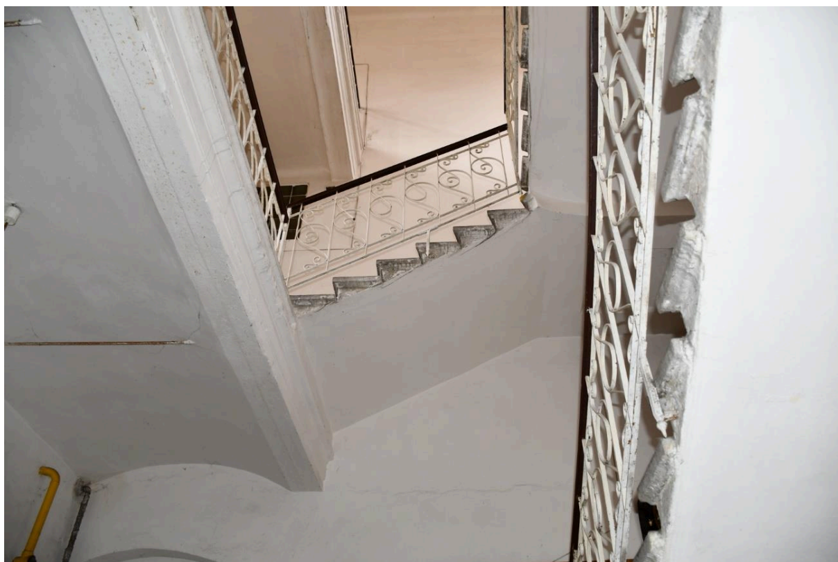
pohled na schodišťový prostor z přízemí