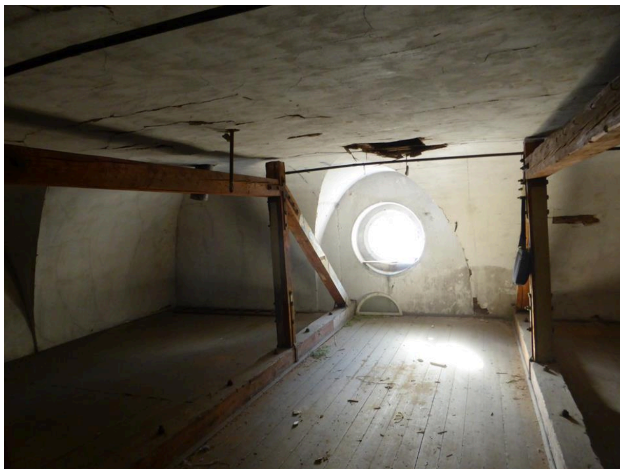
tzv. malá půda, prostor nad tanečním sálem (pohled na původní kruhové okno bývalé kaple) v SV přístavbě domu